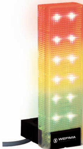
Pevné nastavení rozložení barev