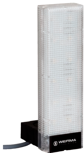
Neaktivní sloupek VarioSIGN