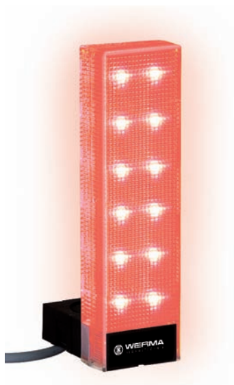
Osvětlení sloupku jednou z barev – zdůraznění výstrahy